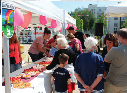
Samedi 4 juin Ouverture de la Fête : Discours du maire et apéritif populaire.