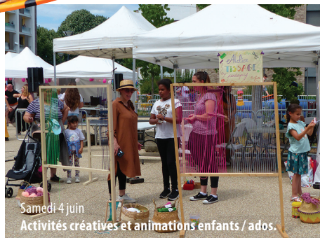
Samedi 4 juin Activités créatives et animations enfants / ados.