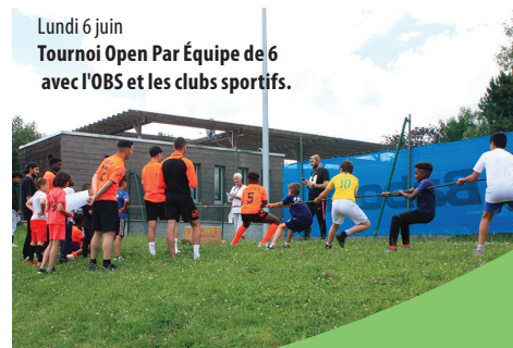
Lundi 6 juin Tournoi Open Par Équipe de 6 avec l'OBS et les clubs sportifs.