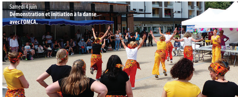
Samedi 4 juin Démonstration et initiation à la danse avec l'OMCA.