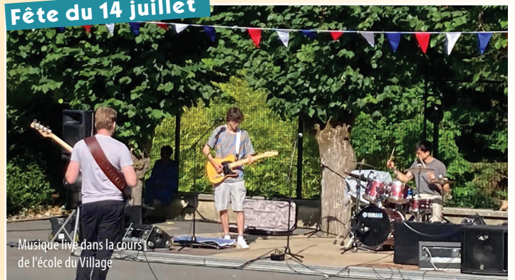
Musique live dans la cour de l'école du Village

Le 14 juillet a été célébré en bleu-blanc-rouge et en musique. L'ambiance simple et festive a ravi les bouffémontois(e)s présent(e)s.