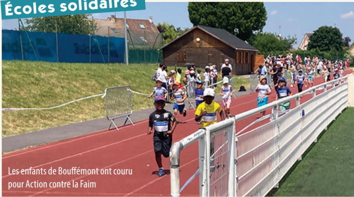
Les enfants de Bouffémont ont couru pour Action contre la Faim

Début juin, les écoliers ont participé avec leurs enseignants, Atsem et parents à une course solidaire au profit d'Action contre la Faim. Cet événement inter-écoles a permis de remettre à l'ONG internationale humanitaire la jolie somme de 11 648 €. Bravo aux enseignants pour cette initiative qui fut aussi l'occasion de sensibiliser les enfants aux inégalités et à la lutte contre la faim dans le monde.