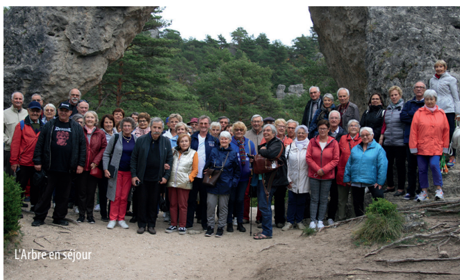
L'Arbre en séjour