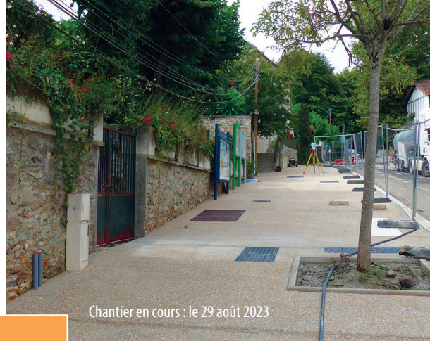
Chantier en cours : le 29 août 2023

La fin des travaux en cours, concerne la réfection des enrobés et du béton désactivé sur l'ensemble de la zone, y compris sur le parking et le parvis de l'église.