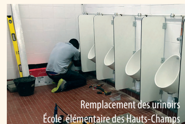
Remplacement des urinoirs École élémentaire des Hauts-Champs