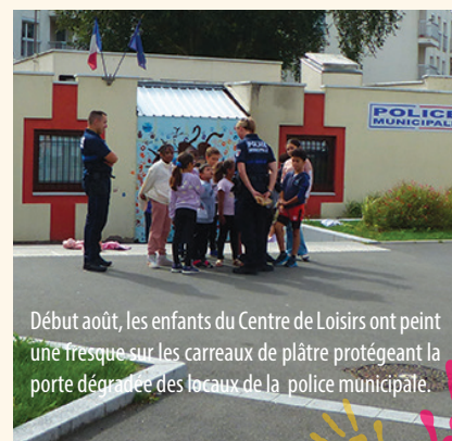
Début août, les enfants du Centre de Loisirs ont peint une fresque sur les carreaux de plâtre protégeant la porte dégradée des locaux de la police municipale.

Cet été, la porte principale de l'Espace Lesseps a été vandalisée. Même si la dégradation n'empêche pas les agents de police municipale d'utiliser les locaux, malheureusement les activités associatives et culturelles notamment les cours de musique de l'OMCA sont contraintes d'être déplacées, jusqu'en janvier au moins, en attendant la prise en charge par l'assurance et les aides de l'État pour assurer la réparation.