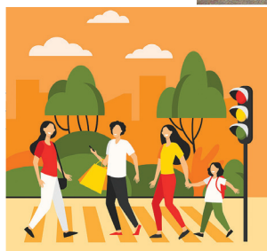
Le passage piéton sera protégé par un système de feux tricolores.