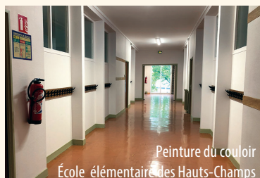
Peinture du couloir École élémentaire des Hauts-Champs

Aux Hauts-Champs par exemple les services techniques ont effectué des travaux de peinture. Côté sanitaires, les urinoirs et cloisons séparatives ont été remplacés.